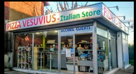
Dégustations offertes pour nos prospects sur nos 3 points de vente